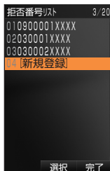
拒否番号リスト画面