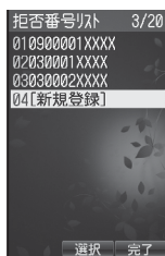
拒否番号リスト画面