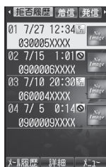
拒否履歴一覧画面