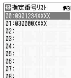
指定番号リスト画面