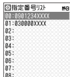
指定番号リスト画面