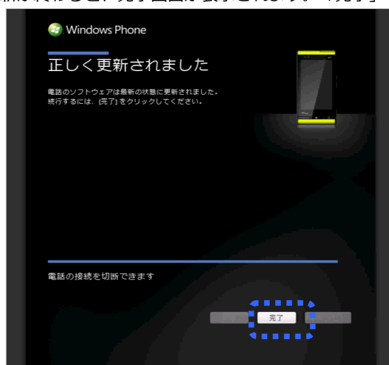
Zune PC ソフトウェア