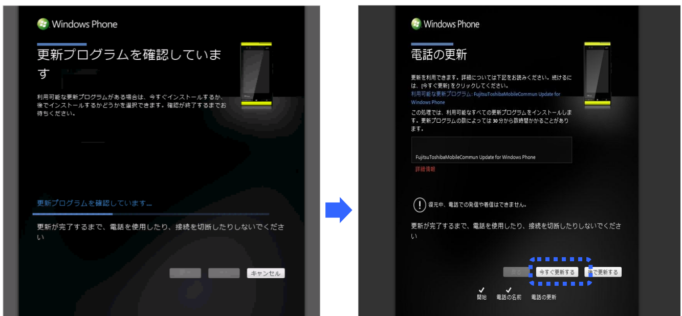
Zune PC ソフトウェア